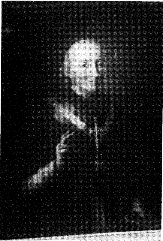
Retrato del cardenal Lorenzana

arzobispos (Fabián y Fuero, Morcillo, Lorenzana) y su obra americana: fundación de ciudades, labor legislativa, actividad evangelizadora y de reforma de la Iglesia. Incluye también diversos mapas en los que aparecen algunas de las muchas ciudades y territorios que llevan los nombres de los de nuestra región: Toledo, Cuenca, Guadalajara, Talavera, Ocaña, Cañete. Reproducciones de obras científicas y literarias editadas en América por autores nacidos en lo que hoy es Castilla-La Mancha: otras editadas en Toledo en los siglos XVI - XVIII de gran importancia para el conocimiento de América, como la Cuarta Carta de Relación enviada por Hernán Cortés al Emperador, la primera edición de la Historia Natural de las Indias redactada por Fernández de Oviedo, o los Concilios Mexicanos del Cardenal Lorenzana.