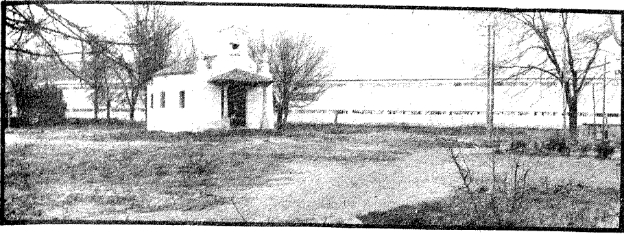
MERCADO DE FRUTAS Y VERDURAS. — El nuevo mercado de frutas y verduras se construirá en breve en los terrenos cercanos a la ermita de San Isidro. El edificio, prefabricado, tendrá estructura funcional e irá cubierto con techo metálico. La Comisión de Obras del ayuntamiento, tras haber anunciado concurso, elegirá el proyecto que estime más conveniente para la función que está llamado a desempeñar. Esta noticia desmiente los rumores de que el mercado de frutas y verduras se ubicaría en el polígono de "La Solana".