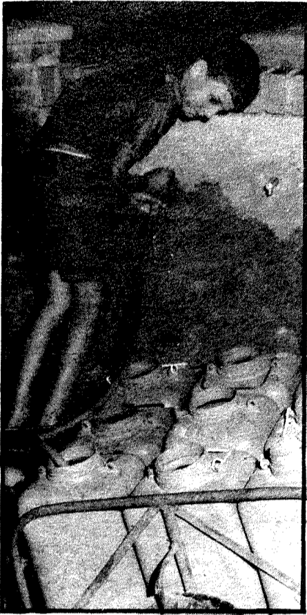
Llenando las tinajas de agua, al caer el día.