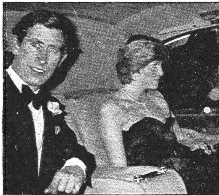
Por un error imperdonable de la diplomacia británica, la Casa Real Española no tendrá ningún representante en la "Boda del siglo"