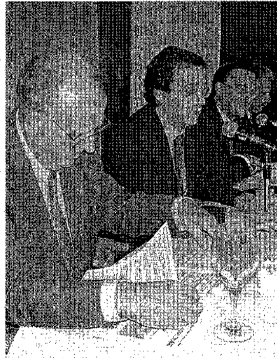
Cerca de 300 personas asistieron a las Jornadas. Abajo a la izquierda, el representante de Telefónica y la Mesa Redonda.

A pesar de que el secretario general de Política Económica y Defensa de la Competencia del Ministerio de Economía reconoció que todos estos sucesos, unidos al proceso de desaceleración que