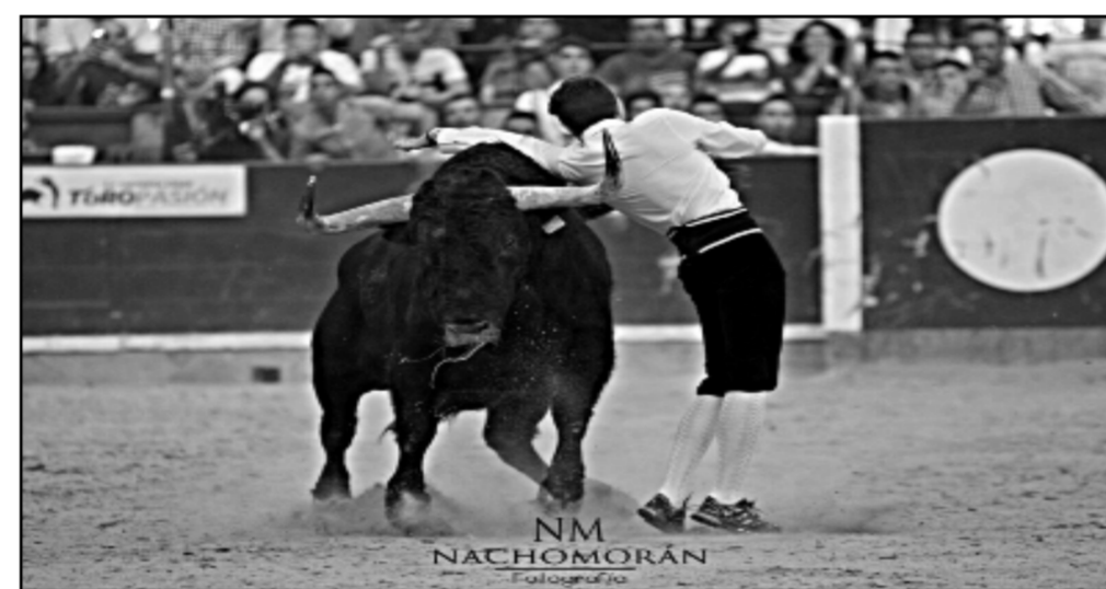
En Zaragoza, Octubre de 2015

No, lo que se gana no es paralelo a lo que hacemos y al riesgo al que nos exponemos. Yo