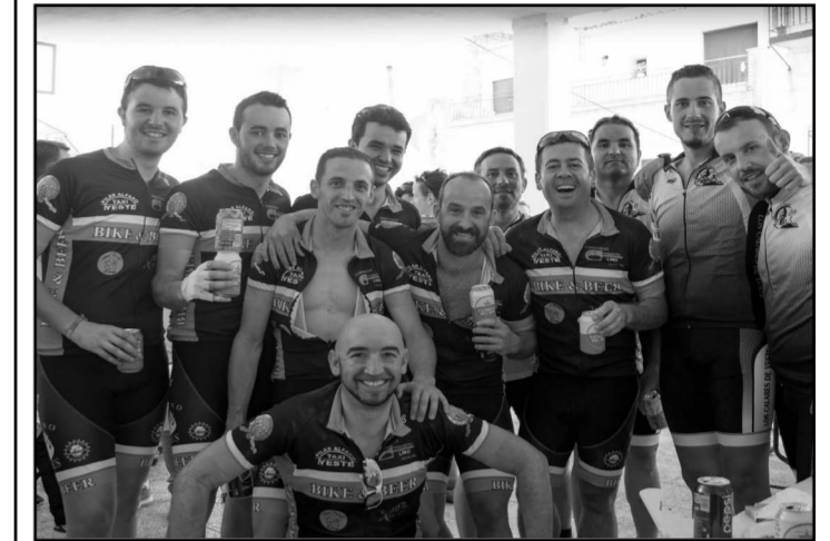
Ciclistas locales tras la carrera