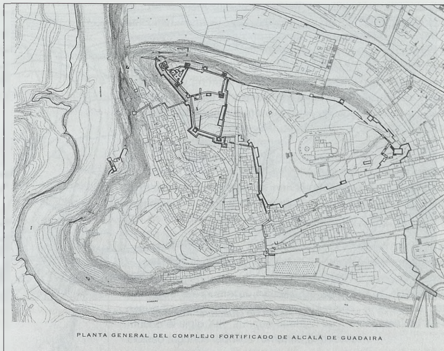
Fig. 4. Alcalá de Guadaira. Planta