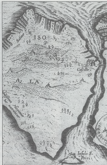
Plano de Höfnagel (1564), que representa una estructura indeterminada en el islote