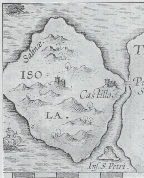
Plano anónimo de hacia 1570 muy similar al de Höfnagel

nara en la pequeña isla. Los textos indican que "La isla de Cádiz se halla en la desembocadura del río de Sevilla y mide doce millas de largo; toda ella es un arenal llano y el agua potable se extrae de pozos. Contiene restos de templos antiguos y dos castillos, uno llamado Sancti Petri y el otro al-Mal'ab (el teatro). En Sancti Petri hay una iglesia muy venerada por los cristianos (...)" (Dikr, II, pp. 71-73) y también describen la cuestión de la siguiente forma: "Península de Al-Andalus, a alguna distancia de Itálica, una de las ciudades de la región de Sevilla. La longitud de esta península, de Sur a Norte, es de doce millas; y su máxima anchura, una milla. Está cubierta de cultivos de rica vegetación. Los rebaños son en su mayor parte de cabras. En la parte boscosa de la península, crecen pinos e inhiesta. (...) Se ve todavía sobre la cima que se encuentra al otro lado de la península, las ruinas de un antiguo castillo. En ese mismo lugar se eleva la iglesia conocida bajo el nombre de San Pedro. (...)" (AL-HIMYAR: Ki_b al-rawd# al-mi't_r f?_habar al-aqt_r , pp. 290-298). Este castillo podría identificarse con