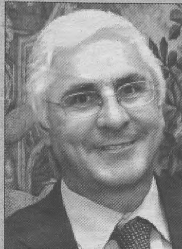
José María Barreda, presidente del Gobierno regional