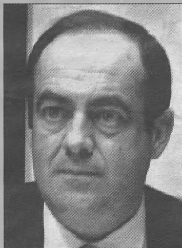
José Bono Martínez, ministro de Defensa