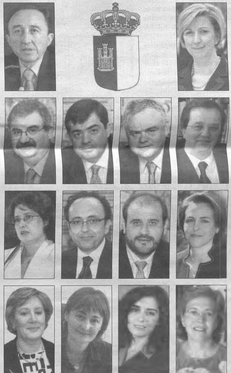
El nuevo Gobierno incluye como novedad el nombramiento de una vicepresidenta. Se trata de un Gobierno paritario, con seis consejeras y seis consejeros. Así, se refuerza el área económica y, como novedad, se crea la Consejería de Justicia y la de Turismo. Además, en la Consejería de Ordenación del Territorio y Vivienda se incluirán las competencias sobre agua.

El ministro de Administraciones Públicas, Jordi Sevilla, felicitó al presidente Barreda por tener "muchas gente dispuesta a defender la Región como lo hacemos todos los que creemos en la Democracia, la libertad y en España". del pueblo y que simboliza un compromiso con la Constitución Española y con el Estado de Autonomía.