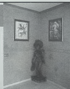
Detalle en pintura estuco

C/ Las Palmeras, parcela 22 bis Urbanización las Nieves • Nambroca • Toledo Tel./Fax: 925 27 88 49 • Móvil: 657 96 23 46