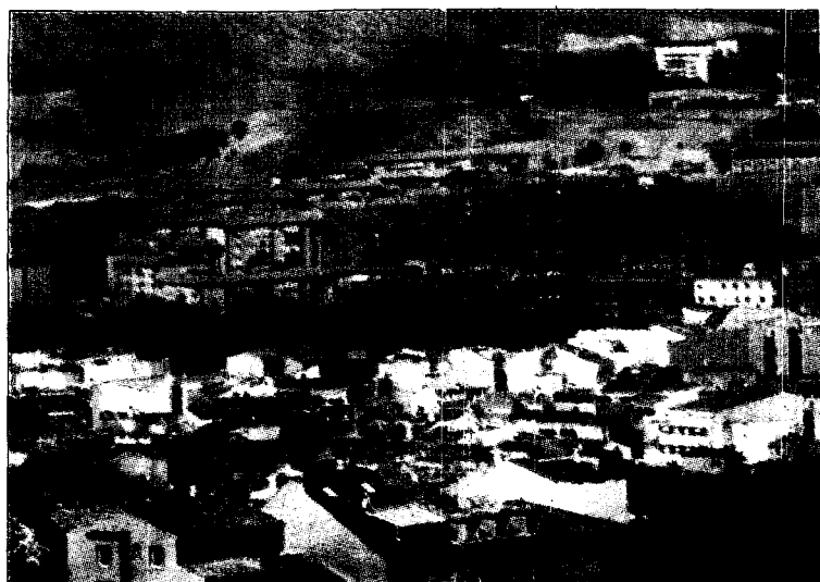
La parte del sueldo destinada a la compra de vivienda no debe superar el 30%/L.T.

ciente de viviendas con precios asequibles que no detraigan más del 20% de los ingresos, mayor construcción de viviendas públicas y establecer cupos obligatorios de reserva de vivienda protegida.