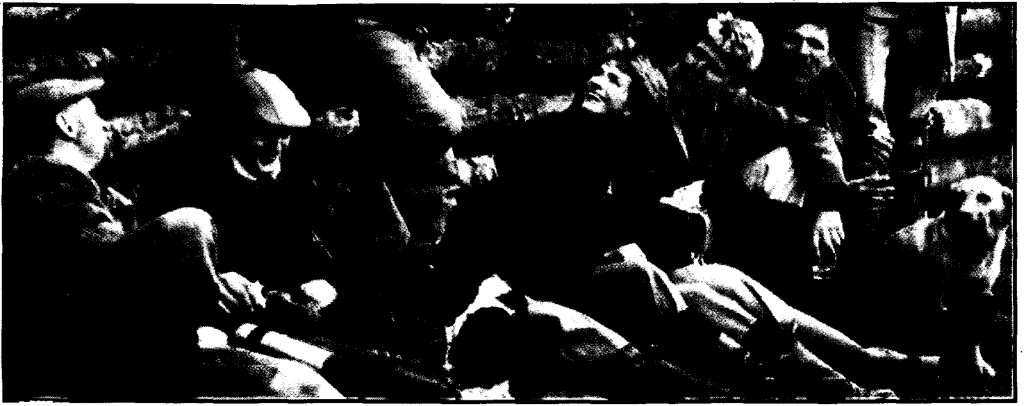
La chaqueta Barbour es ideal para ir de caza y destaca por su extraordinaria impermeabilidad.