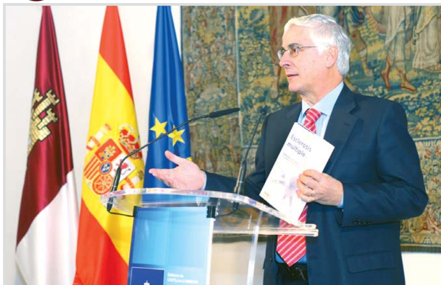
José María Barreda.