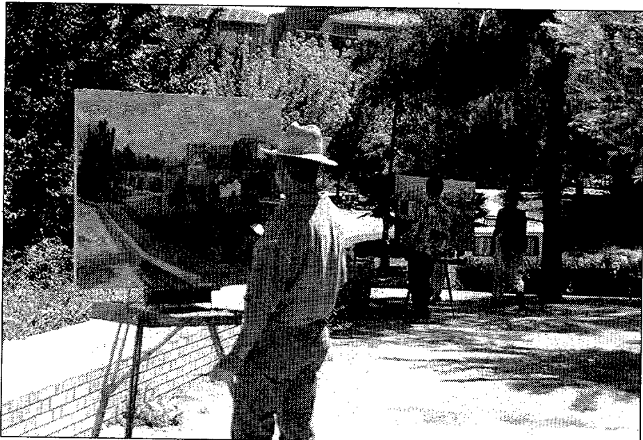
Los rincones más atractivos de Guadalajara fueron tomados por pinceles y lienzos.