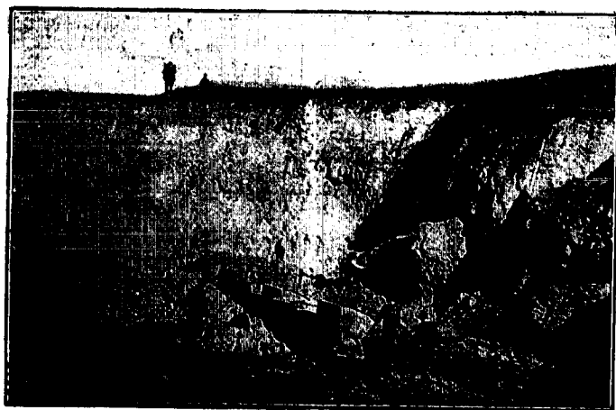
Un interesante aspecto de las obras, en toda intensidad, que bien pudiéramos titular «El hombre vence a la montaña».