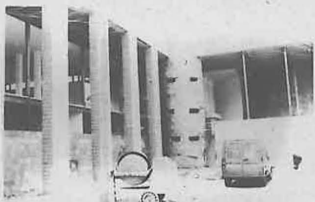
En la fachada las columnas y el vidrio, jugarán un papel destacado