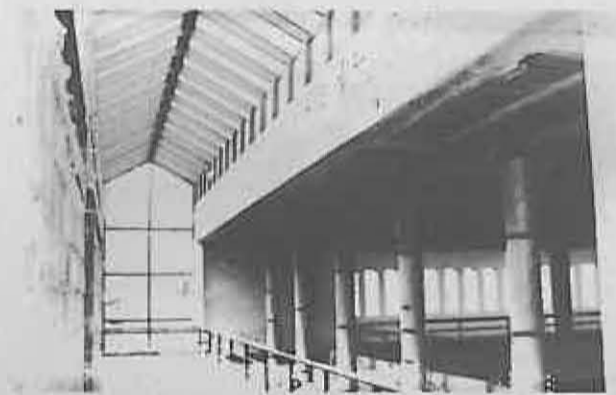
Las vidrieras de la galería aumentarán la luz del salón y la biblioteca.