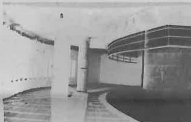
El anfiteatro aumentará el aforo del salón.