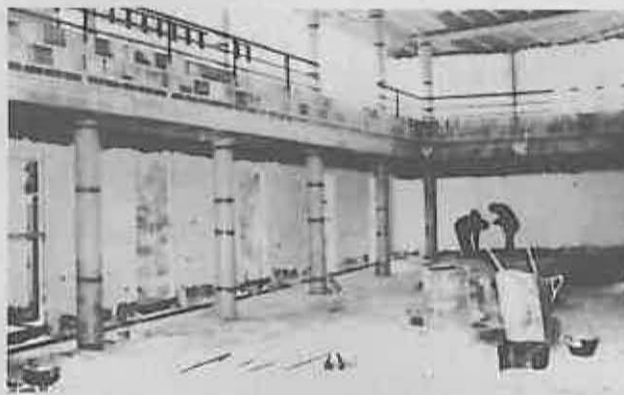
El salón de actos es el espacio principal de la casa.