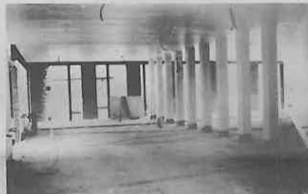
Biblioteca: destaca el aprovechamiento de la luz natural.