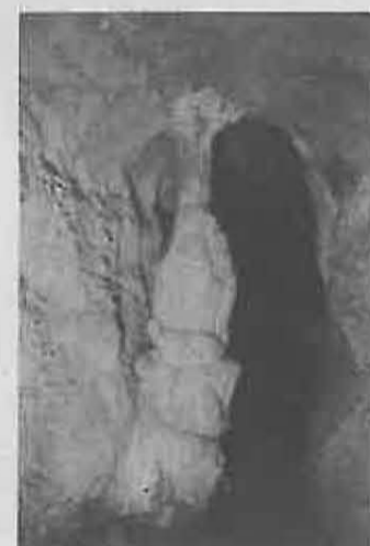
Detalle de la cueva.

Para los componentes del Taller de Ecología, el respaldo dado por la