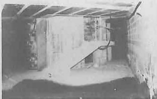
El sótano acoge las galerías y los cuartos de calefacción y ascensor.