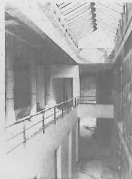
La galería servirá para el montaje de exposiciones.