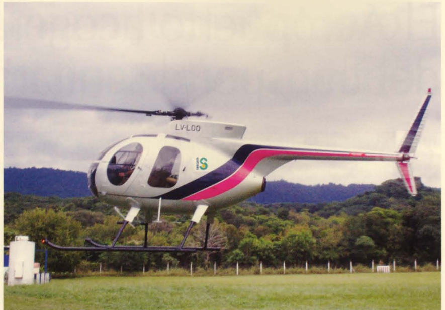
El helipuerto posibilitaría que los helicópteros abandonasen las zonas urbanas donde ahora se asientan.

Posteriormente, durante los años 2009 y 2010 se completarán las helisuperficies nocturnas de Ciudad Real y Albacete, momento en el que el horario de 24 horas se extenderá a toda la región. Con el fin de alcanzar las más de 200 helisuperficies previstas, la Gerencia de Urgencias, Emergencias y Transporte Sani-