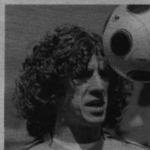
Carles Puyol podrá recuperar su sitio en la defensa.

Toni y Villa son la personificación de los dos estilos que se medirán el domingo. Villa y España llegan mejor; Toni e Italia suelen llegar más alto.