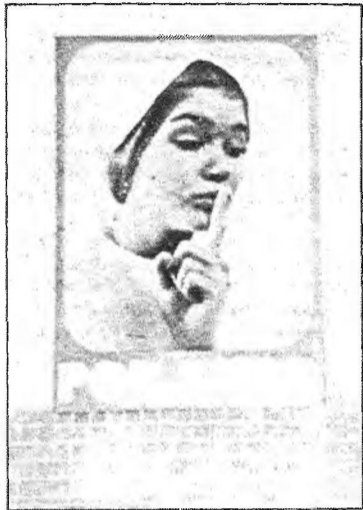
"Por favor, silencio". Esta parece ser la consigna seguida por las autoridades sanitarias, en el tema de la neumonía, tanto, quizá, por el deseo de no causar una expectación excesiva, como por el desconocimiento etiológico de la enfermedad.

la causa y la forma de transmisión de la neumonía? Son vanos los médicos que han dado su hipótesis, mientras que en medios oficiales, muy prudentes, casi no se producían declaraciones sobre el tema. Este