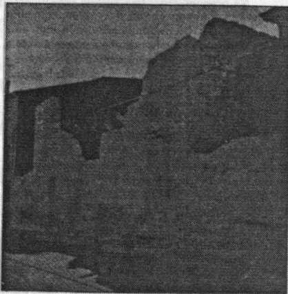
Esto es lo que hace el PSOE. Por ellos la Casa del Pueblo está en ruinas.

Tras el descalabro electoral que el PSOE llevó en Tarazona en las pasadas elecciones municipales (tenían el champán preparado) el grupo socialista, en vez de trabajar por su pueblo, se dedica a lanzar bulos, mentiras y a guardar silencio cuando tienen que hablar. Actuando así, sólo pretenden desgastar al alcalde y equipo de gobierno para dentro de unos años presentarse como los salvadores, pero se equivocan, en las próximas elecciones el pueblo elegirá libremente a sus representantes.