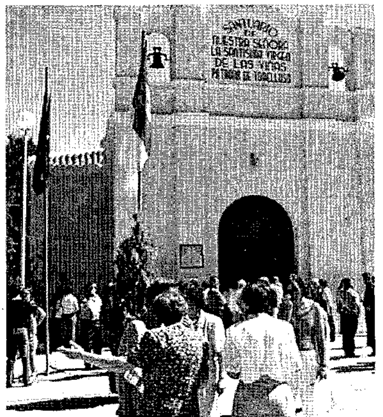
Inmediaciones del cementerio municipal de Tomelloso.

Para participar sólo es necesario hacer una inscripción y abonar una cuota de 1.000 pesetas.