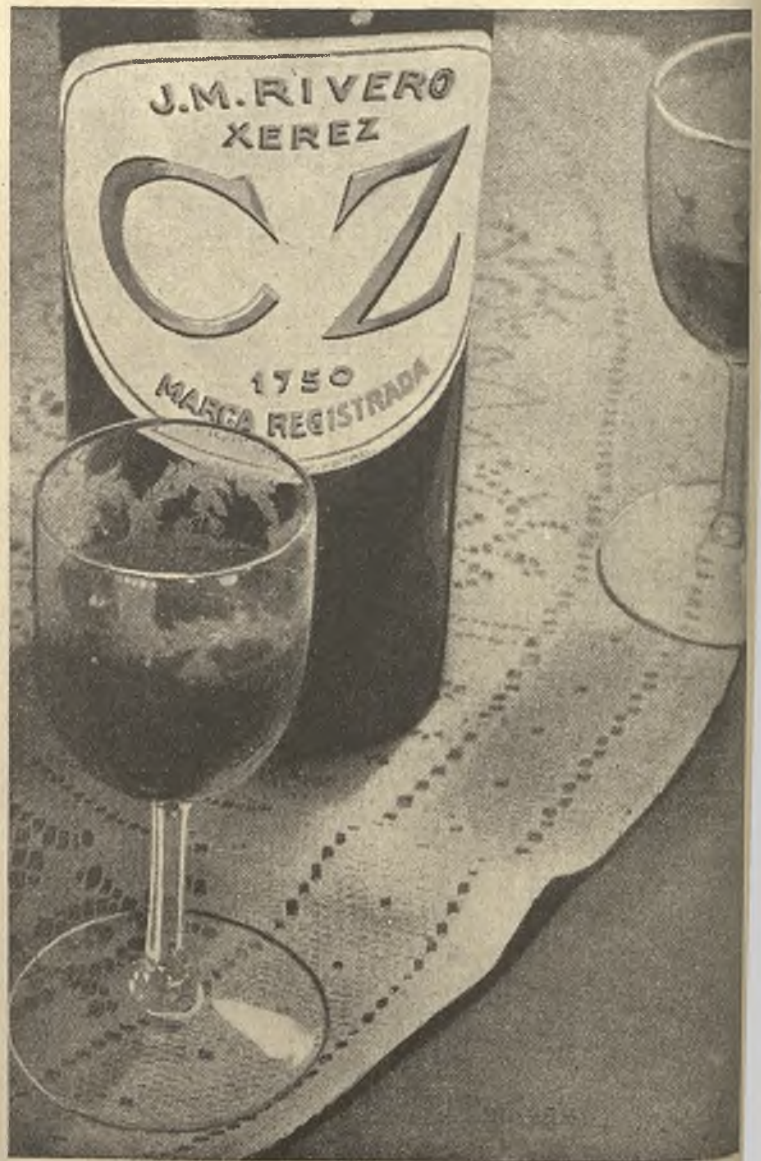
Pidan Fino Rivero, Trafalgar 1805 y Coñac Viejísimo C. Z

VERTICALES.—1. Pieza de barro cocido. - Desorden.—II. Estime. - Nota. Soga.—III. Pronombre reflexivo. - Vanidad. - Nota.—IV. Despojar (con falta ortográfica).—V. Acostumbres.—VI. Comercios.—VII. Hacen nido.—VIII. Pronombre. - Arbol leguminoso de Venezuela. Forma del pronombre personal de segunda persona (al revés).—IX. Flor. - En la baraja. - Rastro de la caza.—X. Sentido. Bebida de aguardiente, azúcar y limón.