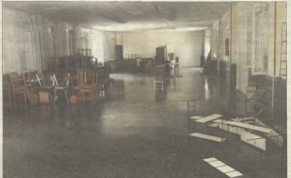
Estado actual del interior del colegio Las Cristinas.

que haya ningún plan que establezca las titulaciones que podrán impartirse en ese nuevo campus, ni el número de alumnos que podrían matricularse.