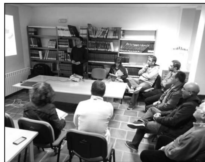
Segunda reunión en Yeste

El resultado de estos foros de participación deberá ser la consecución de proyectos interesantes para el municipio y elevar al Grupo de Acción Local (a través de sus mesas sectoriales y junta directiva) los proyectos de interés comarcal o, esos proyectos que pueden ser susceptibles de apoyo en alguna de las líneas de ayudas que proporcionara el grupo de desarrollo para el próximo periodo.