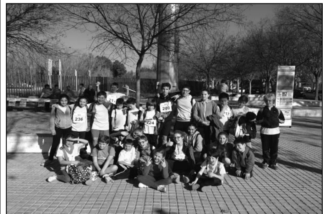
Atletas de Yeste en la prueba de campo a través en Almansa

Por otro lado, el primer fin de semana de Marzo dio el pistoletazo de salida el campeonato de atletismo provincial de pista en Albacete, siendo la participación yestera todavía mayor que la de campo a través. Esta competición se extenderá hasta mediados de Mayo en la capital albaceteña.