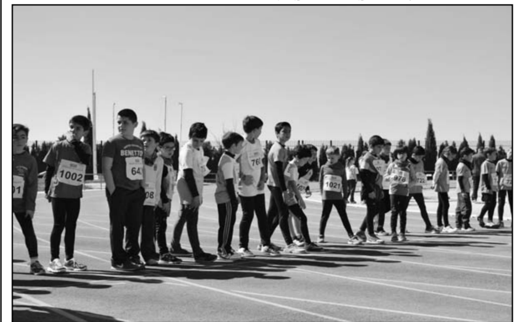
Atletas alevines en la segunda jornada de atletismo en Albacete

- 31 de Diciembre: SAN SILVESTRE YESTERA.