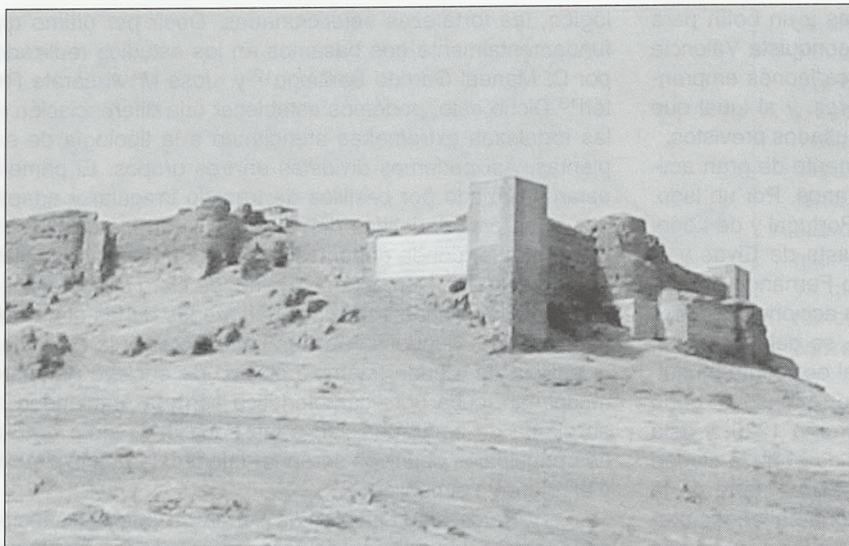
La fortaleza de Montemolín

latinas en las cercanías del pueblo. Pese a no conocerse restos materiales de época visigoda, no es lógico descartar por ello la posibilidad de la población de la villa en esa época. Sin duda, la importancia de Montemolín fue en época musulmana, no sólo como núcleo de población, sino también como enclave fortificado estratégico que protegía los accesos a Sierra Morena, y por tanto a Córdoba y a Sevilla. Hacia 1246 se reconquistó Montemolín, y fue donada a la Orden de Santiago en 1258. En 1282, Alfonso X el Sabio concede ciertos privilegios a la villa por la lealtad demostrada 14 .