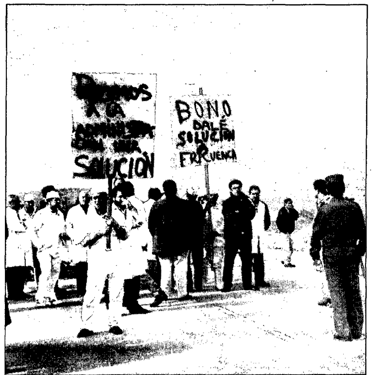
La cruz vino después. El 2 de febrero fue cuando Fricuencia presentaba suspensión de pagos y un expediente de regulación de empleo para reducir su plantilla, de 77 a 30 trabajadores. Después comenzaron las medidas de presión emprendidas por los empleados para evitar su despido, el corte de la N-420 entre ellas.