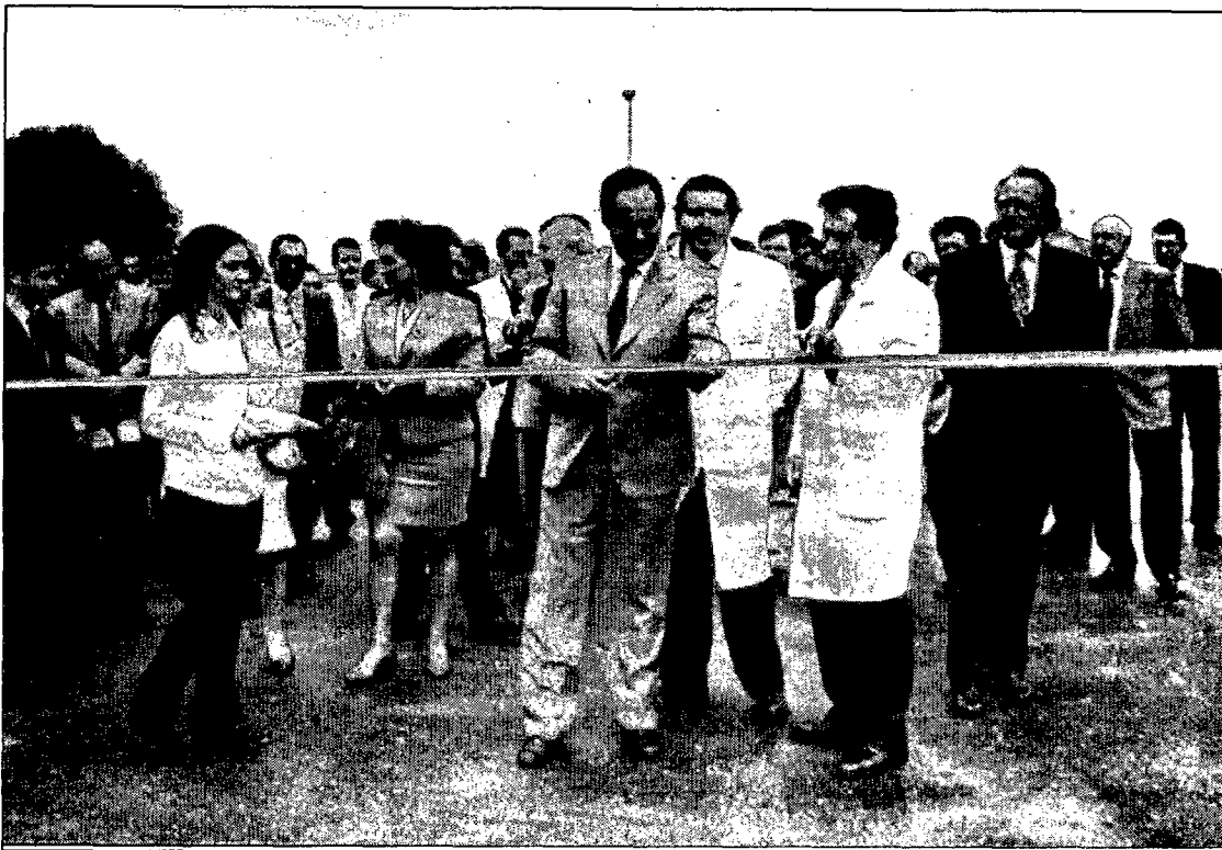
Primero fue esta foto, en julio de 1997, la inauguración del matadero Fricuencia. José Bono, presidente de la región cortaba la cinta que daba por inaugurado en Villar de Olalla, un matadero que venía a solucionar un problema de abastecimiento que tenía la ciudad. Un proyecto en el que se habían invertido 1.230 millones quedaba dispuesto para comenzar su actividad dando trabajo a 125 trabajadores, con perspectiva de aumentar en poco tiempo en 30 más.