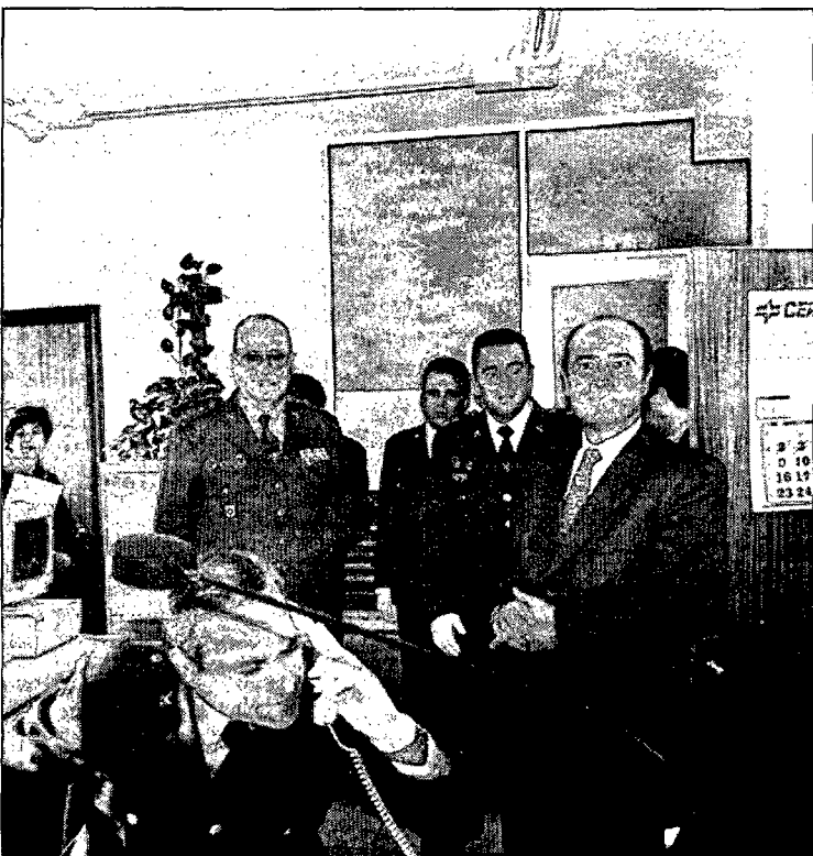
El Director General de la Guardia Civil visitó la 142 Comandancia de Cuenca dentro del ciclo de visitas que estaba realizando. Santiago López Valdivielso estuvo en las dependencias de la 142 Comandancia de Cuenca para conocer de "primera mano" cuál era el estado de las diversas infraestructuras, del material y de los problemas, en general.