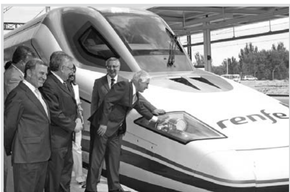
Un momento de la presentación del tren Ave en Albacete.

en inversión hidráulica sin precedentes, pensando en las rentas de nuestros agricultores, ganaderos y sociedad en general”.