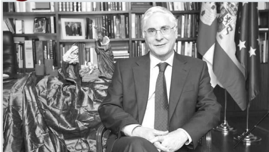
José María Barreda.

perar la situación es, a juicio del presidente Barreda, desde la unidad; “en la medida en que todos trabajemos en la misma dirección, saldremos antes de la situación en la que nos encontramos”.