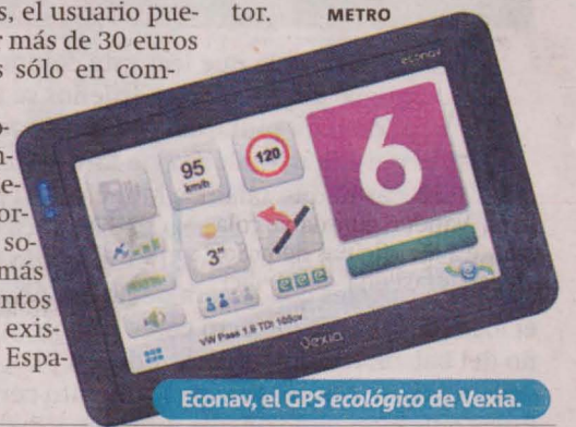
Econav, el GPS ecológico de Vexia.