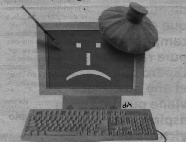
Aproximadamente 10 millones de ordenadores españoles están infectados con algún virus informático.

Esto significa que más de 10 millones de ordenadores españoles están en manos de los ciberdelincuentes. El spyware (programa espía) les permite acceder a la información que el usuario guarda en su equipo con una doble finalidad: acceder a sus