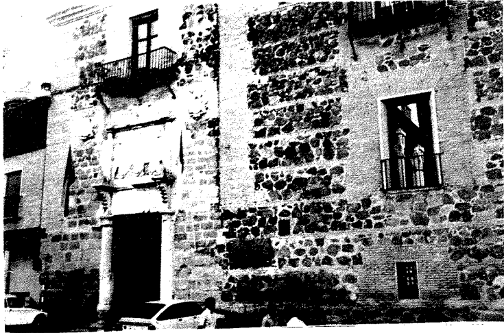
La Junta de Comunidades de Castilla-La Mancha tiene la responsabilidad de administrar un presupuesto que asciende a 5.171.738.000 pts.

será acompañado por distintos Consejeros, según las distintas provincias y su problemática.