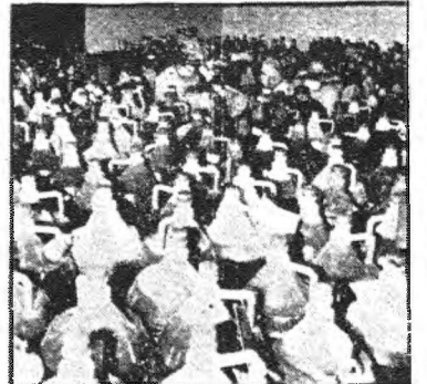
Estas garrafas de aceite presuntamente tóxico, siguen acumulándose en el Ayuntamiento en espera de su análisis y posterior canje

Por otra parte, el PSOE de Toledo ha cursado a los medios informativos el texto de la proposición no de ley socialista para la aprobación de un plan de medidas urgentes, defensa de la salud de los consumidores y de apoyo a los ciudadanos