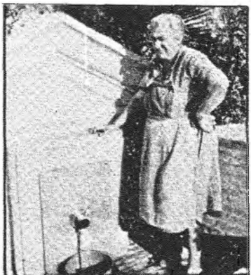
Los vecinos, que llevan bebiendo agua desde siempre, están dispuestos a seguir haciéndolo

Ante los rumores insistentes de que el agua de manantial que mana en una fuente del barrio de Cabrahigos no era potable, "LA REGION" ha conversado con los vecinos para que expliquen sus impresiones sobre este problema. Nada más llegar a la citada fuente pudimos comprobar cómo los vecinos seguran utilizando el agua de manantial. Hablamos con una vecina que estaba cogiendo agua para beber, que al indicarla que el agua no se podía utilizar para beber, nos dijo "que si el agua estuviera mala, ya me tendría que haber muerto yo y mis vecinos".