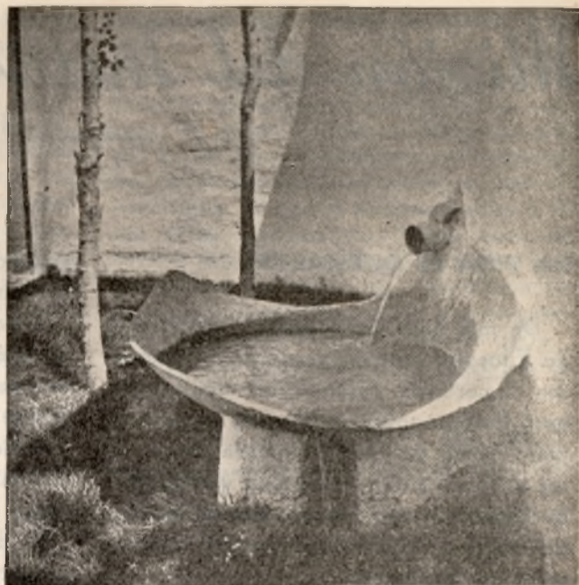
Detalle ornamental del jardín es la fuente hecha con los más típicos y sencillos elementos manchegos: el cántaro y un trozo de tinaja.

La Biblioteca del Centro está unida a la Municipal, si bien los libros y fichas van marcados con sellos diferentes. Cuenta ya con más de 1.500 volúmenes y se esperan en fecha próxima nuevas remesas, tanto por parte de la Dirección General de Enseñanza Laboral como por la Junta de Intercambio y adquisición de publicaciones. En cuanto estén terminados los ficheros, se procederá a su inauguración para el público, aunque en la actualidad ya la utilizan los alumnos y profesorado del Centro.