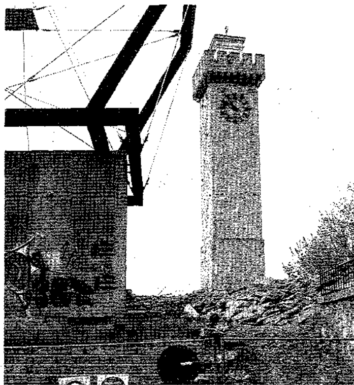
La Torre de Mangana, un monumento emblemático de Cuenca.

En 1926, la fisonomía de la torre cambiará notablemente con la reforma que el arquitecto Fernando de Alcántara llevó a cabo dentro de un estilo neomudejar. Suprimió el chapitel y,