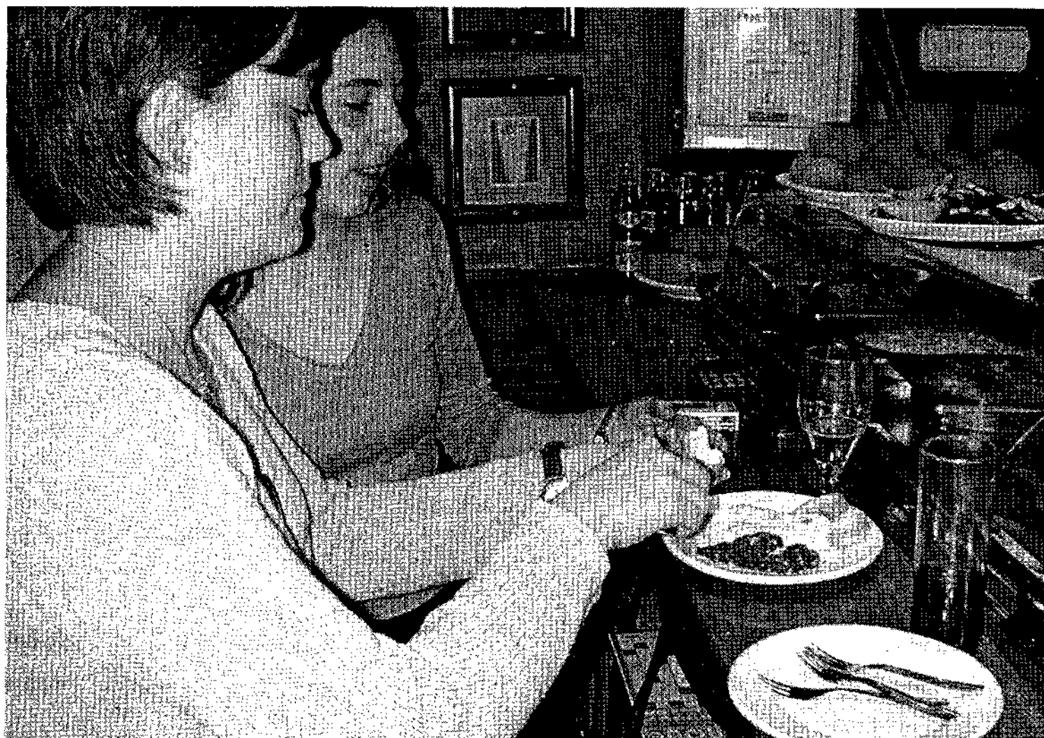
La Agrupación Provincial de Hostelería y Turismo tiene previsto elegir un nuevo presidente el próximo lunes.

HOSTELERÍA Y TURISMO LOS CERCA DE 1.200 SOCIOS DE LA PROVINCIA DECIDIRÁN ENTRE LAS TRES CANDIDATURAS QUE SE PRESENTAN