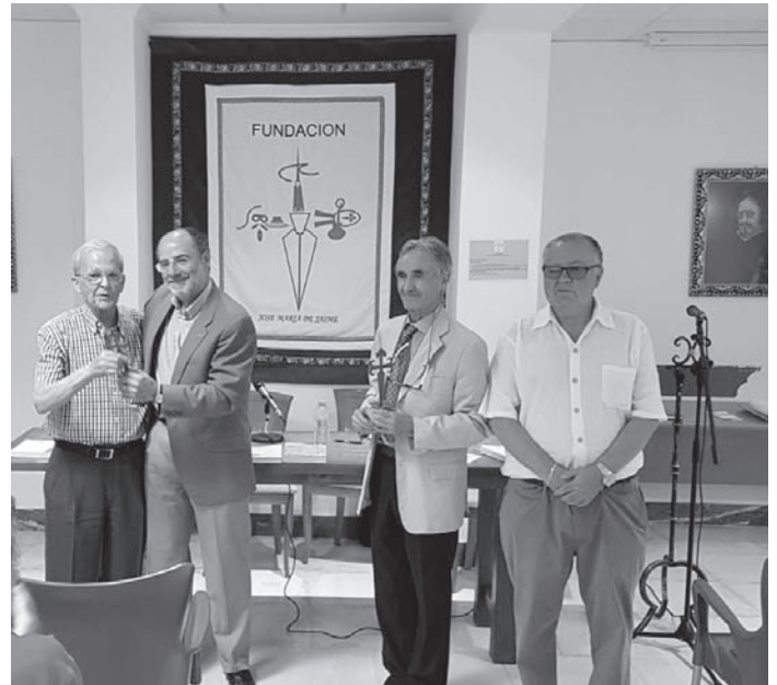
Entrega del símbolo de la Cruz de Santiago a los ponentes