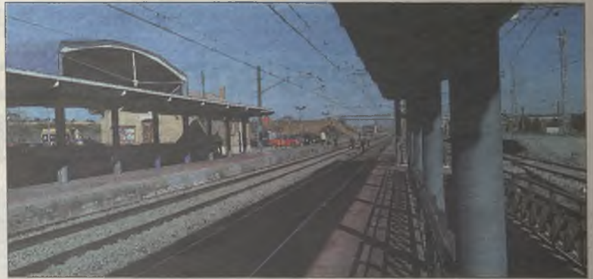
Vista general de la estación de Meco, donde se produjo el fatal accidente

cruzar las vías. Creemos que en ese momento ni vio el paso subterráneo", dice su tío, que añade que lo que le ocurrió fue "un cúmulo de fatalidades, pero que no habrían pasado si esa puerta no se encontrara averiada".