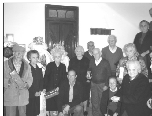
Los Magos de Oriente con los ancianos de la Residencia

El día 5 de Enero Sus Majestades los Reyes Magos trajeron la ilusión a grandes y pequeños. Como todos los años su primera visita fue a la Residencia de ancianos, para después recorrer las calles acompañados de niños y mayores en la cabalgata. Una vez finalizada ésta se dirigieron al Auditorio donde repartieron los regalos a los niños.