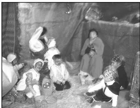
Belén del barrio de la Carretera