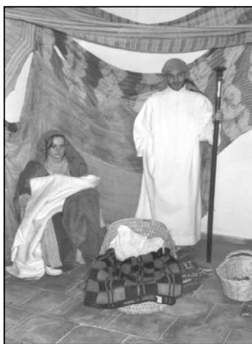
Belén de Santiaguico