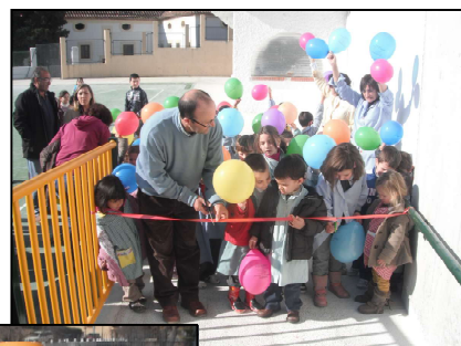
Momento en que se corta la cinta colocada en la entrada de la rampa que da acceso al patio de Infantil

Hacia muchos días que los alumnos preguntaban si ya iban a ir al patio nuevo. Por eso, cuando llegó este día lo celebraron con mucha alegría. Fue impresionante y emocionante verlos entrar corriendo al recinto, con una sonrisa de oreja a oreja.