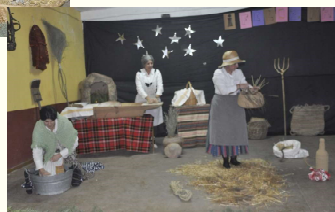
Asociación Cultural de Folklore «El Corpiño»