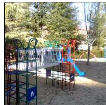
Parque de La Purísima