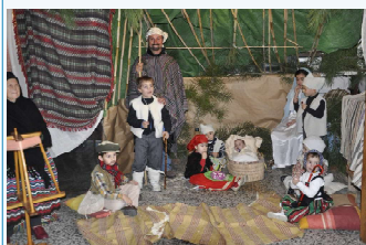
Calle de Arriba