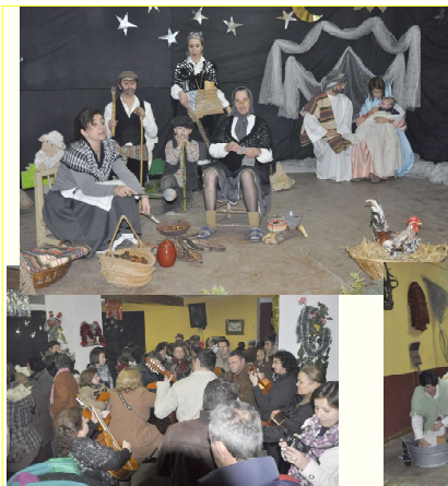
Asociación Cultural Andaluza