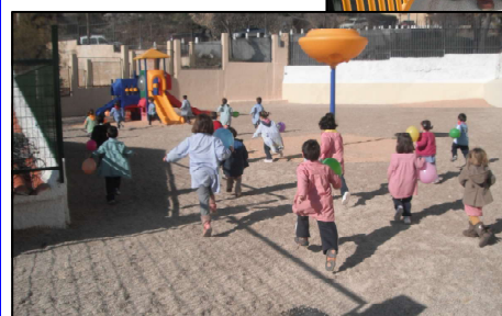
Los/as alumnos/as entraron corriendo a ese espacio al que no han podido acceder durante casi un año