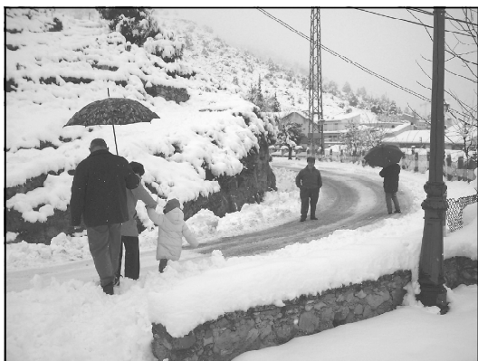
Vista de la carretera desde el Mirador