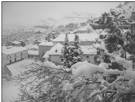
Vista desde el Mirador de la carretera

«El viernes por la mañana me llevé una sorpresa. Cuando abrí la ventana de mi habitación, estaba todo cubierto de nieve. Enseguida me vestí, desayuné y me fui a la calle a hacer un muñeco de nieve. Después vinieron mis primos y amigos y nos tiramos bolas de nieve.