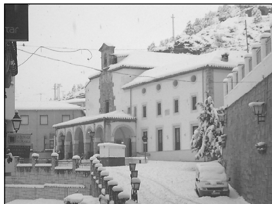
El Convento Franciscano

«El sábado salí a la calle e hice un muñeco de nieve. Le puse en la nariz una zanahoria; la boca, un plátano; las orejas, un palo; las manos eran palas y los pies eran unos zapatos hechos de nieve. el domingo cosí, hice los deberes, leí y jugué con mis amigas a la pelea de bolas de nieve. Luego hicimos ángeles acostándonos en la nieve y más tarde correteábamos por toda la nieve».