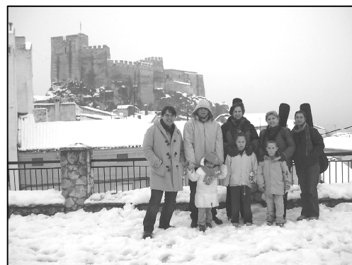
Los sacerdotes y un grupo de mujeres y niños eligieron la vista del Castillo nevado para recordar estos días tan esperados.