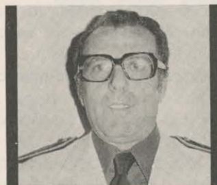
ARAQUE: DE LO DICHO, NA

Durante las últimas semanas, el proceso electoral ha discurrido por otros cauces, en los que Cuenca tiene poco que decir. Para aspirar a ocupar un cargo nacional hay que