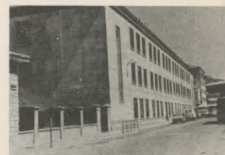
A VER QUIEN LIMPIA ESTO

muy posible que en pensarlo pase el tiempo y llegue el primer día del año —o, si se quiere, el primer día del segundo trimestre de clases— sin que se haya producido la