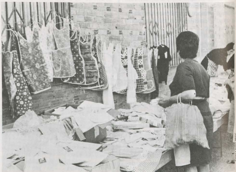
HAY QUE ENCONTRAR TIEMPO PARA COMPRAR Y ATENDER LA CASA

También la huerta emplea más a mujeres y niños que a hombres. Si tenemos en cuenta que se siembran gran cantidad de hortalizas que son muy variadas en cuanto a la época de su consumo, se justifican los cuarenta días citados de dedicación femenina. Importante capítulo es el de la venta