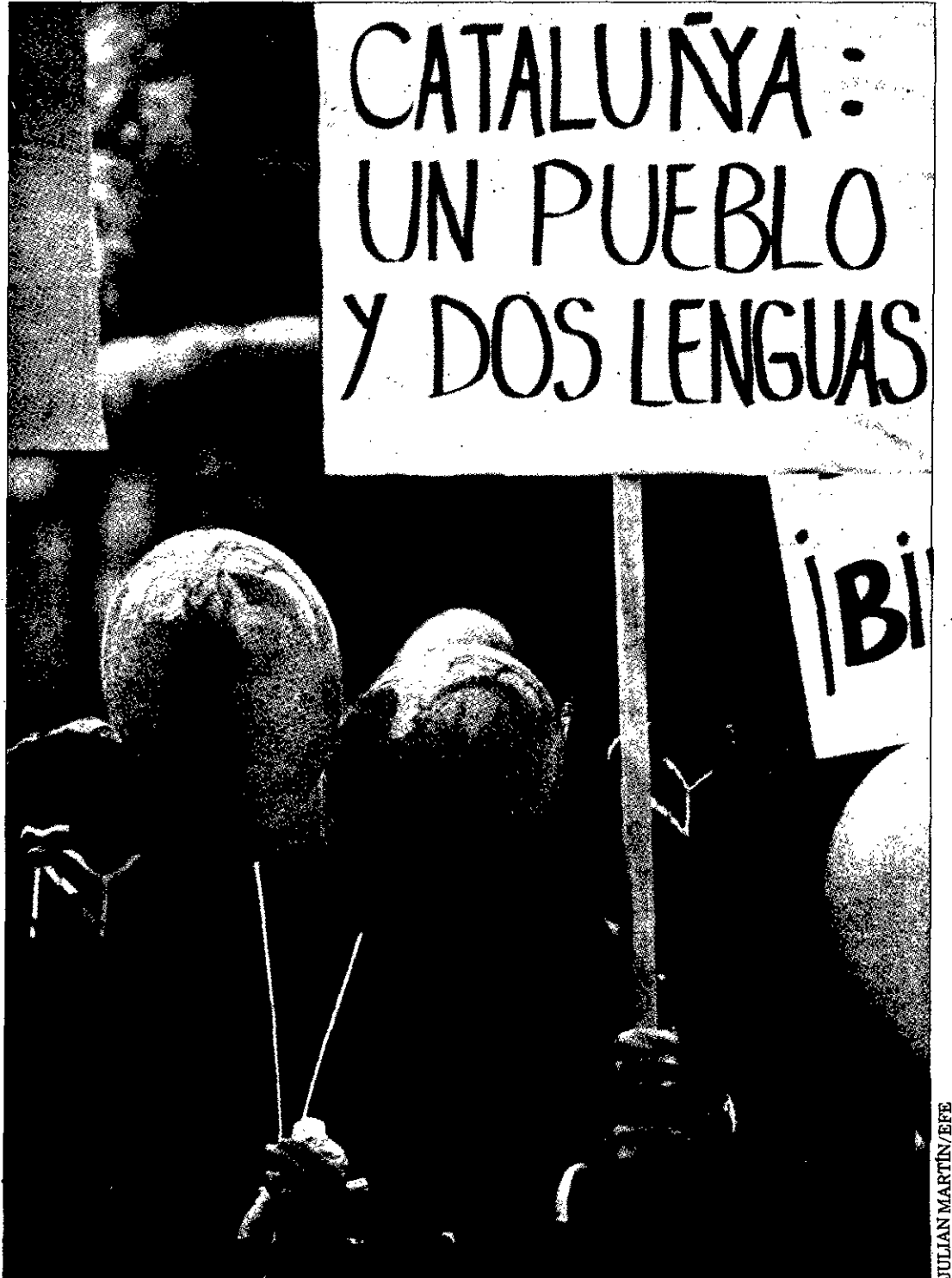
PROTESTAS Miembros de una asociación pro derechos de los castellano hablantes se manifestaron ante el Parlament.

La Ley del Catalán fue aprobada ayer por 102 votos a favor y 25, del PP y Esquerra Republicana, en contra