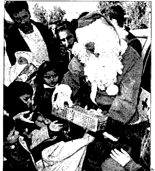
MEDICINAS DE REGALO Santa Claus visita un hospital de Bagdad.

La Prensa de ayer indicaba también que las fuerzas de seguridad han iniciado operaciones especiales contra los guerrilleros islamistas, unos días antes del mes de ayuno del Ramadán, en el que los grupos armados acostumbra a intensificar sus ataques. Todas las masacres, que la semana pasada causaron 120 víctimas, están atribuidas al más radical de los grupos armados argelinos, el Grupo Islámico Armado (GIA).