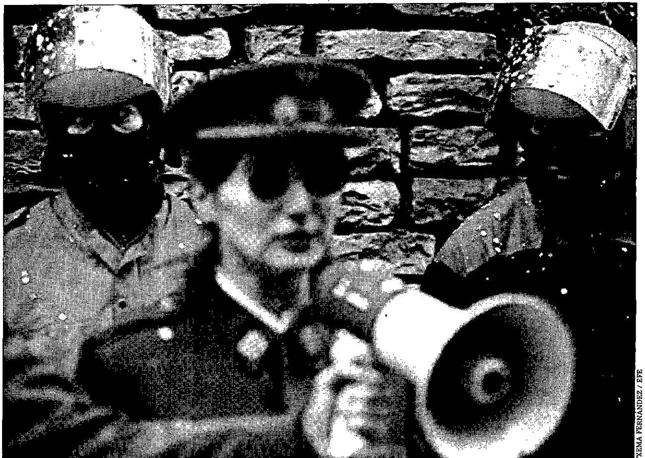
EN ORDEN Agentes de la Ertzaintza, cubiertos de confeti, escuchan la lectura del comunicado que elaboraron los antimilitaristas.

Este escrito está firmado, además de por la Comisión de Defensa de los Derechos de la Persona del Colegio de Abogados de Barcelona, por la Asociación Catalana de Juristas Demócratas, la ONG Juristas Sin Fronteras, la Asociación para la Defensa de los Derechos Humanos, la Asociación Catalana de Mujeres de Carreras Jurídicas y la Asociación de Profesionales para la Cooperación.