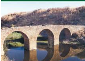
Puente Romano sobre río Tirteafuera