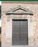
Puerta de la Asunción