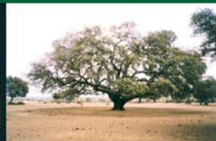
Encina Milenaria o de las mil ovejas