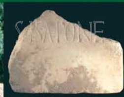
Inscripción ciudad de Sisapo