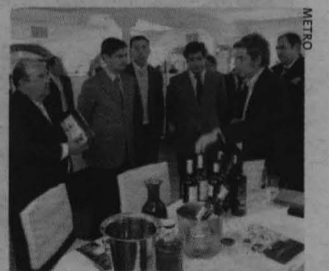
Un momento de la cata.

El autobús trasladará a los usuarios de la comarca de Campo de Criptana (Ciudad Real) hasta el centro de Educación Especial María Auxiliadora y al Centro Ocupacional y de Día Rogelio Sánchez. METRO