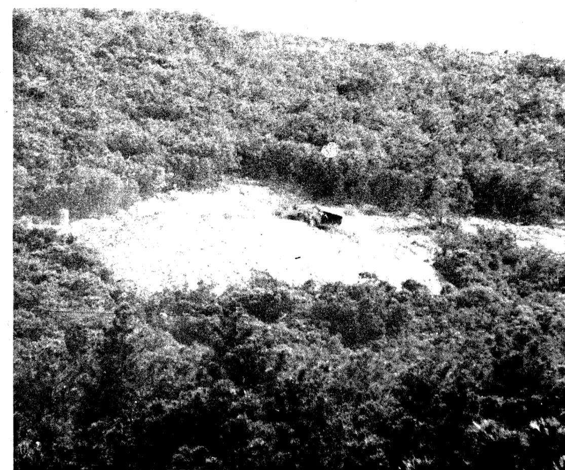
Una excavadora realizando trabajos en el túnel, lo que prueba que las obras están en marcha.