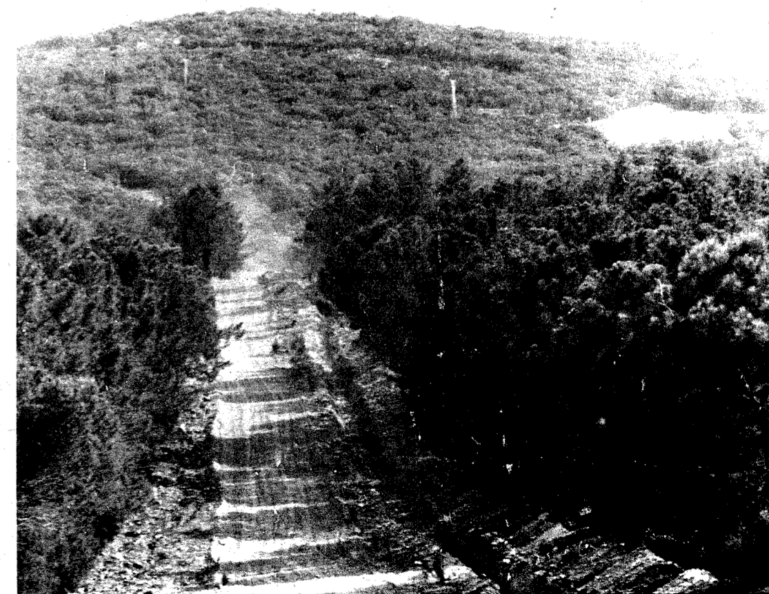
Camino que da acceso al túnel visible a la derecha de la fotografía. Para hacerlo ha sido necesario cortar una gran cantidad de pinos.