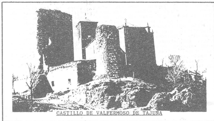
CASTILLO DE VALFERMOSO DE TAJUNA