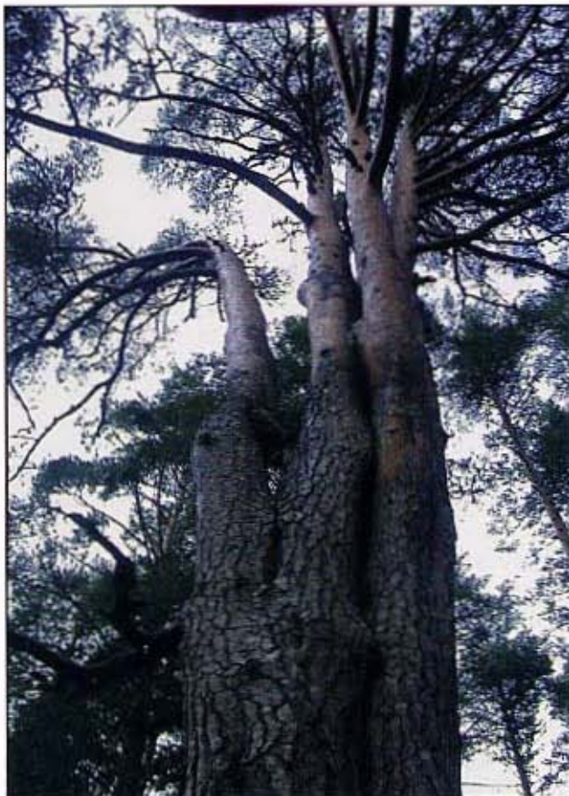
Pino de las 7 Garras